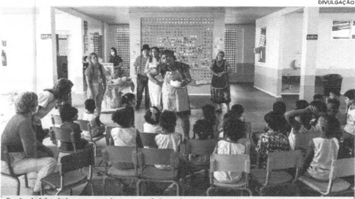
Creche da Liberdade promoveu diversas atividades artísticas para as crianças

Com o intuito de fortalecer a arte literária no Maranhão, a Secretaria de Estado da Educação (Seduc) deu início, na segunda-feira (18), à Quinzena do Livro Infantil. A ação será realizada em diversos municípios e segue até o dia 29 de abril. O evento é alusivo ao Dia Nacional do Livro Infantil, comemorado no dia 18 de abril, em homenagem ao escritor de literatura infantil Monteiro Lobato, e ao Dia Internacional do Livro Infantil e Juvenil, que homenageia o também escritor Hans Christian Andersen, comemorado no dia 2 de abril. "Estamos com diversas atividades culturais e de estímulo à leitura, em São Luís e outros municípios. Nos próximos dias, até o dia 29 de abril, desenvolvendo atividades com o objetivo de movimentar a comunidade escolar, e os moradores no entorno da escola, para o uso das bibliotecas que estão disponíveis com bons livros e que são importantes para construção de novos leitores", destacou a superintendente da Seduc, Adelaide Diniz. Em São Luís, a cerimônia de abertura da Quinzena do Livro Infantil aconteceu no Centro Integral de Educação Infantil Creche da Liberdade, com acolhida e boas-vindas; apresentação da peça, de autoria de Monteiro Lobato, "A pílula falante"; contação de História - O coelho; canções - Música do Jacaré, entre outras atividades. A gestora pedagógica da Creche da Liberdade, Lillian Valéria Rodrigues Lemos Soares, ressaltou a importância da Quinzena do Livro Infantil, para estimular a leitura dos